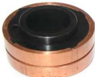
A-107 COLECTOR NASHVILLE EJE \varnothing 17,65 (38 x 20)