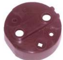
A-73 TAPA APACHE