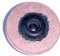
A-21 PUENTE DE SOLENOIDE