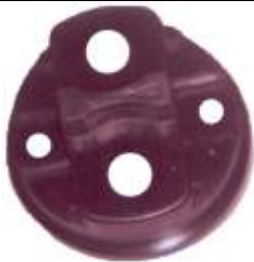
A-74 MITSUBISHI CHICA