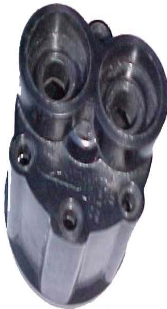
A-58 FIAT 619