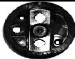
A-126 BOSCH INICION PALA DZE TORNILLO LATERAL HEXAGONAL