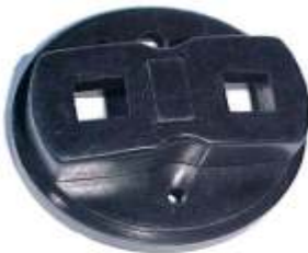
A-44 PEUGUEOT, RENAULT