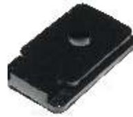
A-115 GOMA SALIDA DE CAMPO BOSCH