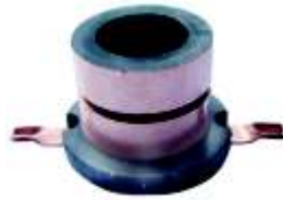
A-141 COLECTOR M. MARELLI, FIESTA, TRANSIT EJE \varnothing 17 (26x25)