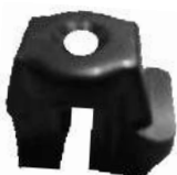
A-78 PORTA CARBÓN INDIEL, MARELLI