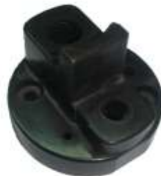
A-84 HITACHI ALTA