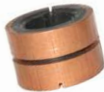
A-111 COLECTOR MARELLI EJE \varnothing 17 (30 x 20,50)