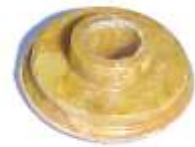
A-08 MICARTA ARGELITE