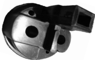
A-69 BOSCH CON ENCHUFE