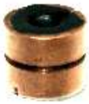
A-131 COLECTOR MOTORCRAFT, F. KA EJE \varnothing 5 (18x15,50)