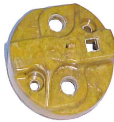
A-47 MICARTA WACSA