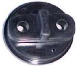
A-02 DUNA, SAVEIRO, BMW