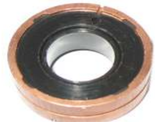
A-106 COLECTOR ARGELITE EJE \varnothing 17 (36 x 18,60)