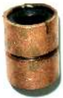
A-134 COLECTOR DELCO CHEVETTE EJE \varnothing 12 (22,5x22)