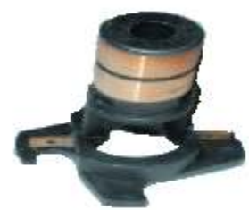
A-175 COLECTOR DE ALTERNADOR (6,5x16)