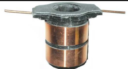
A-163 COLECTOR DE ALTERNADOR (17x30)