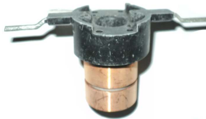
A-174 COLECTOR ALT. FORD 6G (13,4x27)