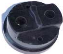
A-09 MOTOR CRAF, FORD