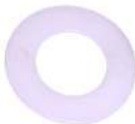
A-53 BOBINA FALCON