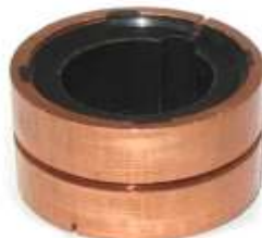
A-105 COLECTOR WAPSA EJE \varnothing 20 (32,80 x 20)