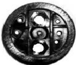
A-125 BOSCH INICION PALA TORNILLO HEXAGONAL