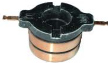
A-168 COLECTOR ALT. ISUZU (17x34)