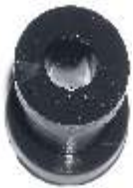
A-117 GOMA SALIDA DE CAMPO RASTROJERO, BOSCH