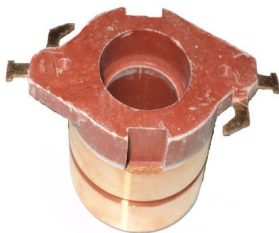
A-173 COLECTOR ALT. MITSUBISHI (17,4x34)