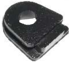
A-130 GOMA SALIDA DE CAMPO INDIEL VW, CUMMINGS