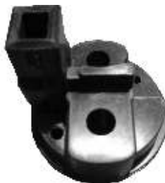
A-72 INDIEL CON ENCHUFE