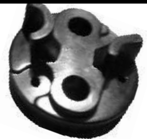
A-65 DELCO REMI