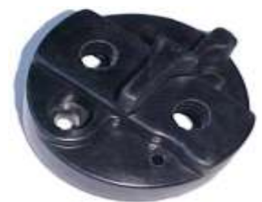
A-29 FIAT MARELLI