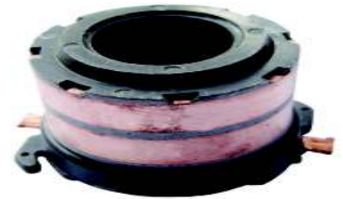
A-145 COLECTOR MITSUBISHI CONDEPRESOR EJE \varnothing 17,50 (33,50x27,50)