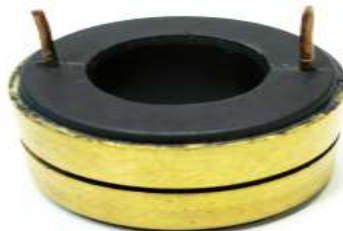
A-159 COLECTOR DE ALTERNADOR (25x50)