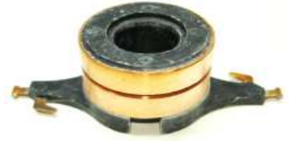
A-169 COLECTOR ALT. ISUZU (16,8x35)