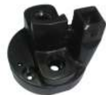
A-93 HITACHI CON ENCHUFE