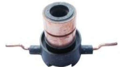
A-139 COLECTOR MOTORCRAFT EJE \varnothing 13,50 (27x36,50)