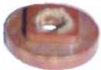
A-11 MICARTA INDIEL