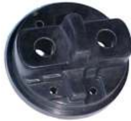
A-31 ARGELITE, RENAULT MICARTA