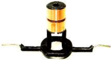
A-170 COLECTOR ALT. FORD 4G SERIES IR/IF (6x16x34)