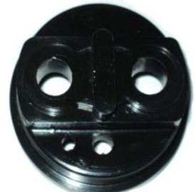
A-45 NASHVILLE, BRASIL BAQUELITA