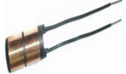
A-166 COLECTOR ALT. NIPPONDENSO (8,8x14,50)