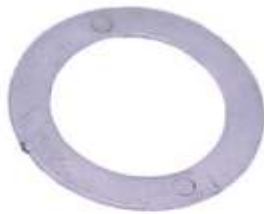
A-52 BOBINA A.N. 115