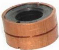
A-104 COLECTOR GAREF EJE \varnothing 17 (32,80 x 22)