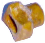
A-10 A.N. 115 MICARTA