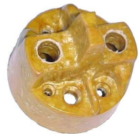
A-50 A.N 115 MICARTA