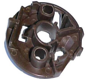
A-61 PORTA CARBÓN VALEO