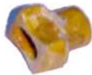
A-10 A.N. 115 BAQUELITA