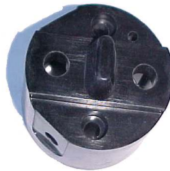
A-17 TRIA GACEL