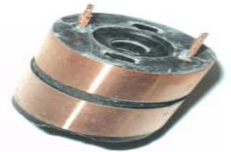
A-172 COLECTOR ALT. MOTOROLA PRESTOLITE (10x24,9)