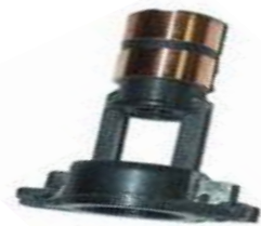
A-136 COLECTOR ALT. BOSCH, VW POLO, PEUGEOT 405