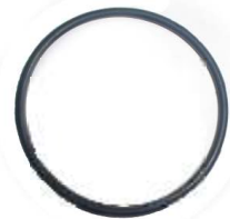
A-88 JUNTA TAUNUS, SIERRA