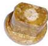
A-51 REGISTRO 1400