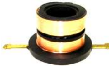
A-156 COLECTOR DE ALTERNADOR (15x25x25,50)