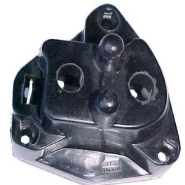
A-43 FIAT 1500 ALTA