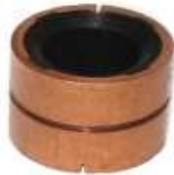
A-99 COLECTOR BOSCH EJE \varnothing 17 (28 x 21,90)