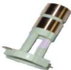
A-137 COLECTOR ALT. VALEO, RENAULT 19, PEUGEOT