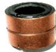
A-133 COLECTOR DELCO REMY EJE \varnothing 18.50 (30x25)