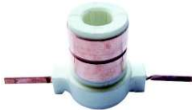
A-144 COLECTOR MOTORCRAFT, F. KA, FIESTA EJE \varnothing 13,50 (27x35)