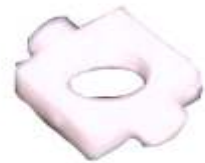
A-54 REGISTRO RENAULT TS