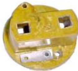
A-41 MICARTA IME