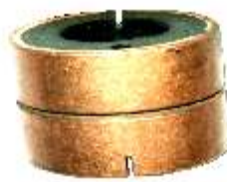
A-135 COLECTOR ALT. BOSCH EJE \varnothing 14 (30x23)