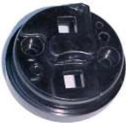
A-38 GACEL, SIERRA, RENAULT