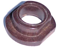
A-16 MICARTA YHONDIR