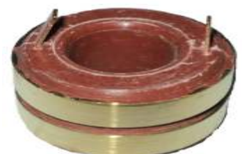
A-160 COLECTOR DE ALTERNADOR (19x40)