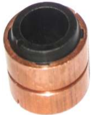
A-110 COLECTOR PARIS RHONE EJE \varnothing 17 (30 x 20,50)