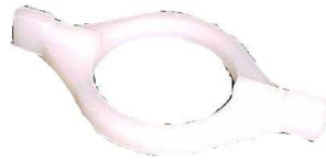
A-33 HORQUILLA POLARA