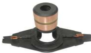
A-138 COLECTOR ALT. MARELLI, FIAT PALIO / SIENA