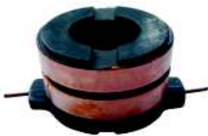
A-146 COLECTOR ALT. ISUZU, TOYOTA EJE \varnothing 17 (26,50x35)