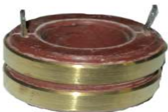
A-161 COLECTOR DE ALTERNADOR (20,9x40)