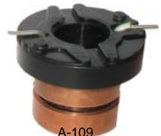
A-109 COLECTOR HITACHI EJE \varnothing 14 (27,50 x 32)