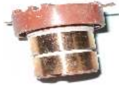
A-165 COLECTOR ALT. HITACHI (14x27)