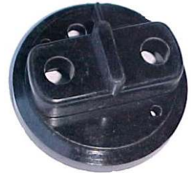
A-35 VALEO MICARTA