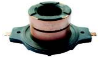
A-142 COLECTOR ALT. VALEO RENAULT EXPRESS