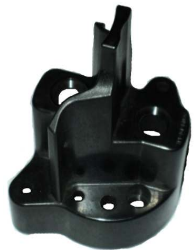
A-176 TAPA INDIEL PARA ARRANQUE PESADO