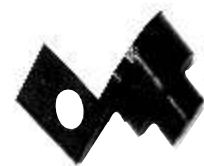
A-129 GOMA TAPA TORNILLO SALIDA DE CAMPO INDIEL, GAREF