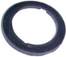
A-34 GOMA A.N. 115