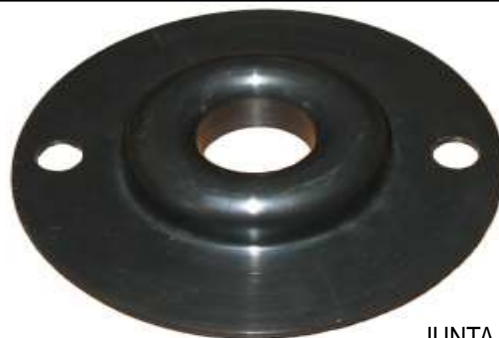
A-113 JUNTA MOTOR ALTA / BAJA