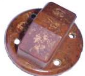
A-18 MICARTA RASTROJERO