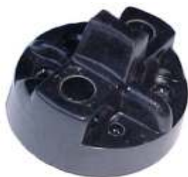
A-27 A.N. 115, 12w 24w