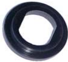
A-20 FRENO RENAULT