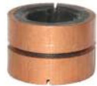
A-100 COLECTOR BOSCH EJE \varnothing 17 (30 x 23)