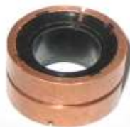
A-108 COLECTOR INDIEL EJE \varnothing 14,30 (25,40 x 18,50)