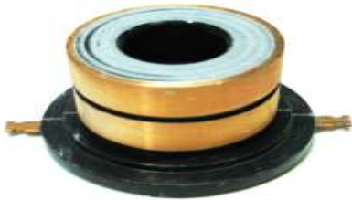
A-167 COLECTOR ALT. ISUZU (16x32)