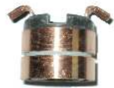
A-148 COLECTOR ALT. DELCO REMY, CORSA EJE \varnothing 14