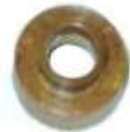
A-05 BUJE A.N. 115 MICARTA