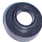
A-05 BUJE A.N. 115 BAQUELITA