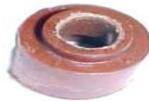
A-62 BUJE SUPERTORQUE