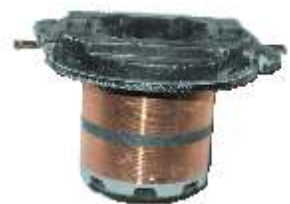
A-151 COLECTOR ALT. MITSUBISHI EJE \varnothing 12,50