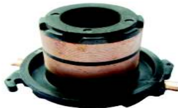
A-147 COLECTOR MITSUBISHI EJE \varnothing 13,50 (23,50x29)