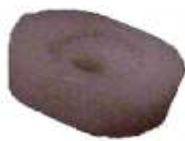
A-55 PATIN RENAULT