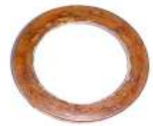
A-22 ARANDELA MICARTA