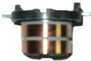
A-149 COLECTOR ALT. DELCO REMY CORSA CON DEPRESOR EJE \varnothing 16,8