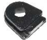
A-116 GOMA SALIDA DE CAMPO INDIEL, R-12