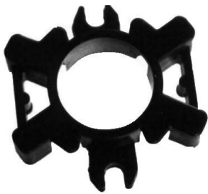
A-71 PORTA CARBÓN MOTORCRAFT