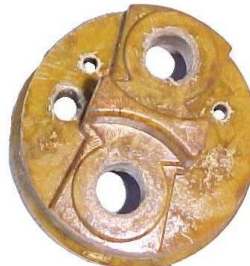
A-45 NASHVILLE, BRASIL MICARTA