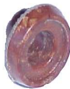
A-12 MICARTA GAREF