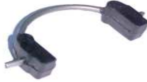
A-37 PATIN TAMATEL