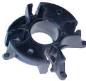
A-60 PORTA CARBÓN FORD + TROQUEL