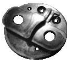
A-67 BOSCH INICIÓN TUERCA