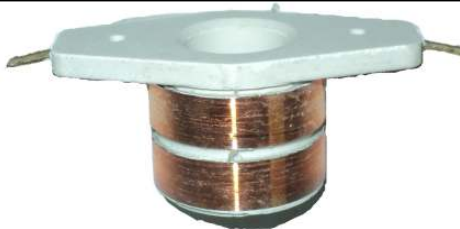
A-158 COLECTOR DE ALTERNADOR (17x30)