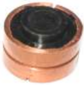
A-143 COLECTOR ALT. RETUR EJE \varnothing 15 (32,80x22,50)