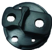
A-83 HITACHI CON ENCHUFE