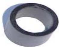
A-14 BUJE YHONDIR