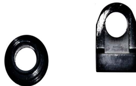
A-124 AISLANTE CAMPO DELCO 37MT, 42MT, TERMINAL BOTA