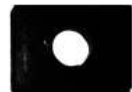
A-122 GOMA SALIDA M.BENZ, BRASILERO (1 AGUJEROS)