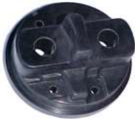
A-30 ARGELITE, RENAULT