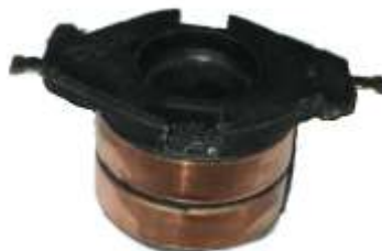
A-150 COLECTOR ALT. MITSUBISHI CON DEPRESOR EJE \varnothing 16,90