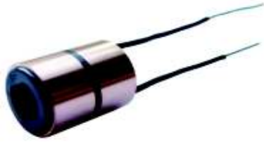
A-140 COLECTOR ALT. DELCO, CORSA EJE \varnothing 7,40 (18,40x20)