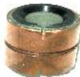
A-132 COLECTOR ALT. NASHVILLE EJE \varnothing 10 (20x20)