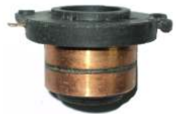
A-154 COLECTOR DE ALTERNADOR (17,50x33)