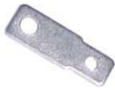
A-23 TERMINAL METÁLICO