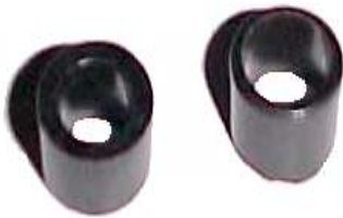
A-42 ø 13X10X09 ø 13X08X09