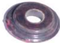
A-07 MICARTA INDIEL