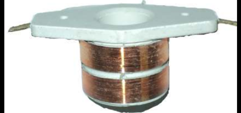
A-157 COLECTOR DE ALTERNADOR (17x31)