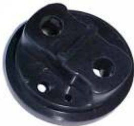
A-64 SPRINTER, MAXION