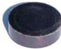
A-48 ROTULA HIDRÁULICA CHICA