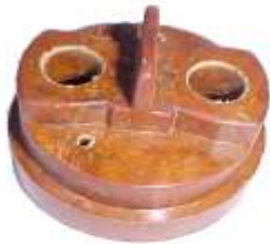
A-57 MICARTA SUPER TORQUE