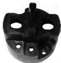
A-127 TAPA MITSUBISHI PARA ARRANQUES PESADOS