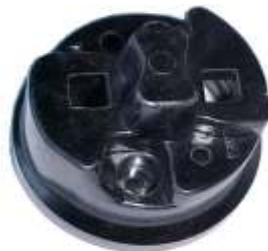
A-28 CABEZAL TAUNUS