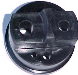
A-03 A.N. FORD DIESEL