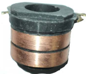
A-155 COLECTOR ALT. MITSUBISHI (17,40x35)