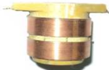
A-153 COLECTOR ALT. KOMATSU (16,8x35)