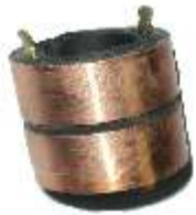
A-152 COLECTOR ALT. MITSUBISHI (14x25)