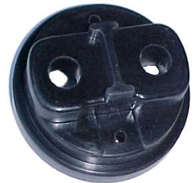
A-63 CABEZAL HITACHI