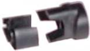
A-32 REGISTRO TAUNUS