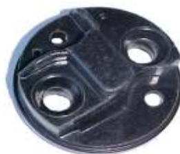
A-25 CHEVROLET BAJA