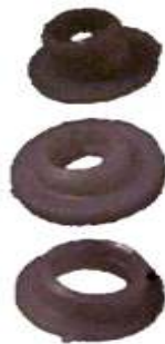
NASHVILLE LARGO NASHVILLE GRUESO NASHVILLE CORTO A-56 BUJES VARIOS