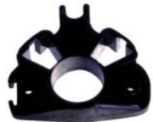
A-70 PORTA CARBÓN PARÍS R