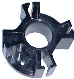
A-59 PORTA CARBÓN FORD + TROQUEL