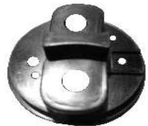
A-68 BOSCH INICIÓN PALA