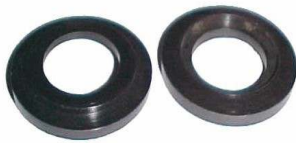
A-40 POLEA FIAT 125