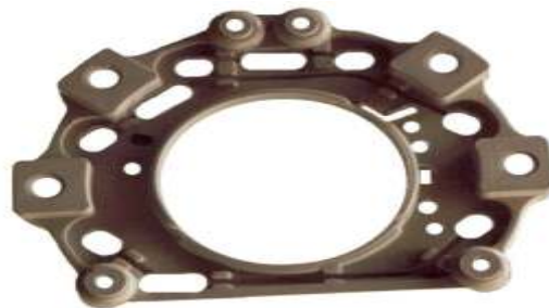
A-75 PLACA INTERCONEXIÓN