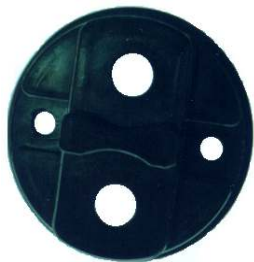
A-66 MITSUBISHI GRANDE