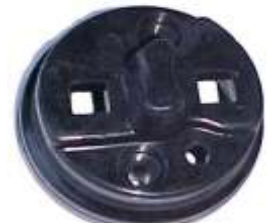
A-26 RENAULT TS