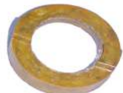
A-19 FRENO FIAT 1500