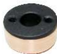
A-162 COLECTOR DE ALTERNADOR (5x14)