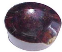
A-49 ROTULA HIDRÁULICA GDE.