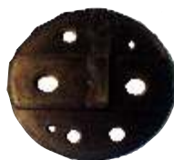
A-128 TAPA DELCO REMY MT 28