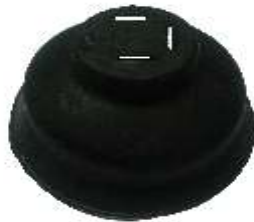
A-87 GOMA ÓPTICA